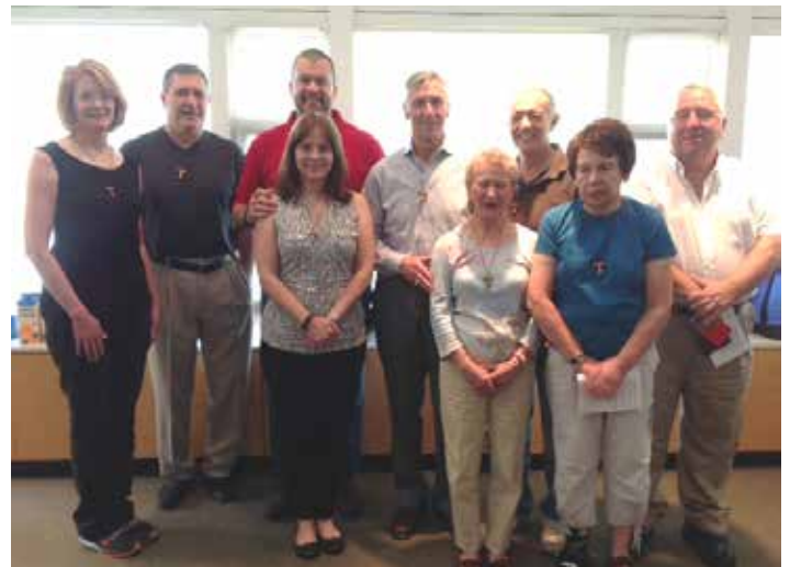
St. Francis of Assisi, Triangle, Va. Candidatos