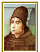
Bl. John Duns Scotus