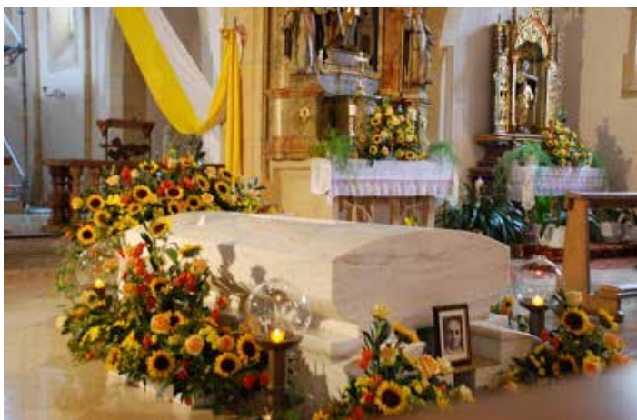
Hermosa tumba del santo en la iglesia parroquial of Mindelstetten, Baviera (Alemania)

María, Reina de la Paz ... Ruega por nosotros