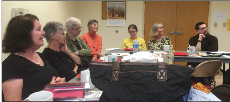
Los miembros del Monte La Verna Fraternidad son un grupo animado y participar en discusiones sustanciosas.

Nuestra fraternidad más joven, Mt. La Verna en Charlottesville es una alegre reunión. La comunidad emergente está en su tercer año y muy activo en el servicio a sus parroquias, la comunidad y la región. Hay tres investigadores y un candidato que están aprendiendo acerca de su llamada al carisma franciscano. Monte La Verna será el anfitrión de un Virginia Hermandades que recolecta en julio. Mantenga un ojo para más anuncios.