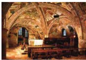
Crypt, St. Francis Basilica

25 Celebration of the Incarnation of Our Lord Jesus Christ