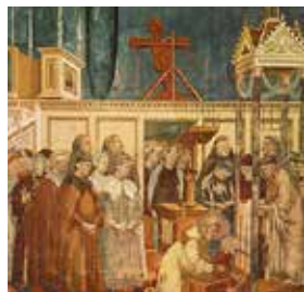
Celebration at Greccio